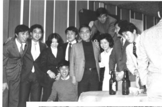
1972-X (2) 大磯PH.jpg