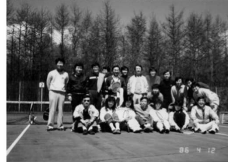
1986 0412 伊豆旅行.jpg