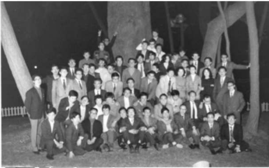
1972-X (1) 大磯PH.jpg